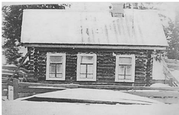
Рисунок 4. Одноквартирный дом промартели «Пламя» постройки 1955 г. [4, д. 81, л. 18]

Как правило, на выставку в целях рекламы, помимо снимков жилых и производственных помещений, артели представляли макеты одноквартирных и двухквартирных домов и других хозяйственных построек.