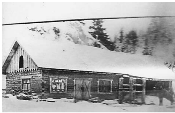
Рисунок 5. Кузница промартели «Пламя» постройки 1953 г. [4, д. 81, л. 19]

Все фотографии отражают результат деятельности людей того времени, они свидетельствуют о том, что промысловые артели округа в основном производили изделия из местного сырья – древесины хвойных и лиственных пород: ель, кедр, сосна, береза, ольха, осина, тал. В качестве утеплительных средств использовались пакля, солома, а водоотталкивающих – смола, вар, деготь. Все изделия в промысловых артелях производились, в большинстве своем, вручную или при помощи простых технических приспособлений и строительных инструментов. Это были, как теперь принято говорить, изделия «экологически чистого производства», сделанные из натурального сырья.