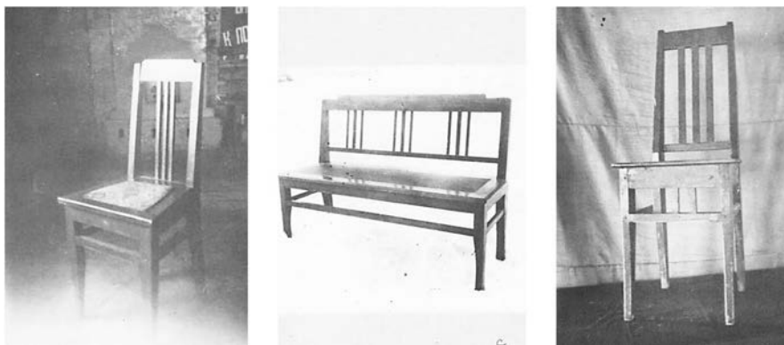
Рисунок 1. Изделия мебели промартели «Стахановец» [4, д. 82, л. 7, 10, 18]

Все присланные промартелью фотоснимки условно можно разделить на несколько групп. К первой относились предметы мебели. На снимках этой группы были представлены двухдверные книжные шкафы рамочной конструкции, предназначенные для хранения книг и бумаг, кухонные табуреты на четырех ножках, столярные березовые стулья с сидением из ткани для взрослых и подростков для отдыха и работы, столярные стулья из древесины хвойных пород, трехместные диваны со спинкой из трех вкладьшей, обитых тканью, нераздвижные столы с одним выдвижным ящиком (Рис. 1).