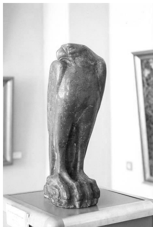
Рисунок 2. Д. Ф. Цаплин. Сокол. 1940-е гг. Искусственный камень. 32,6 x 12,5 x 21,5. От семьи автора. 1976. Москва

романтик и поэт. Кажется, что в портрете выхвачен конкретный жизненный миг – минута творческого озарения. Взгляд писателя устремлен вперед, длинные, прямые волосы откинута с высокого лба, рукой он слегка подпирает голову. Художник не ошибся в выборе материала – гранита. Монолитная глыба, из которой изваян портрет, не потеряла в зрительском восприятии своей массы, и в то же время в скульптуре нет нарочитой тяжеловесности. Красиво, мастерски скульптор обрабатывает поверхность камня в портрете, заставляя отражать свет полированными его частями (лицо, руки) и вбирать тень мягкой, матовой поверхностью одежды и волос.