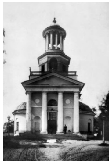
Рисунок 3. Церковь св. Екатерины в Мурино [12]

В этих примерах архитектурное сооружение считается уникальным, так как оно характеризуется единичностью, но является сгустком трансляций, и внешний облик его сформирован в процессе объединения, трансформации и компоновки планировочного, объёмно-пространственного и ордерного решений особенностей архитектуры конкретных мастеров или других сооружений. Основным методологическим подходом в определении авторской уникальности сооружения являются установление иконографических источников и их интерпретация. Как итог, появляется возможность показать избирательность, степень заимствований в переработке композиционных характеристик и тенденций и, соответственно, выявить степень уникальности архитектурных сооружений.