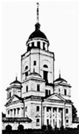
Рисунок 1. Церковь Петра и Павла в Сарепуле [5, с. 57]

Отдельного внимания заслуживает церковь Спаса Преображения в селе Мазунино (1814), которая имеет планировочное решение, широко распространённое для региона, выстроенное по типу «храм кораблём». К квадратному в плане основному объёму примыкают практически равная по ширине трапезная с одной стороны и квадратная апсида – с другой стороны. Сам четверик завершается барабаном с куполом. Объёмно-пространственное решение и ордерная композиция показывают ориентацию на творчество И. Е. Старова и А. Д. Захарова. Наиболее очевидно это проявляется в оформлении притвора, имеющего двухколонный портик типа в «антах», и колокольни, наделённой двумя одноярусными башенками-звонницами, ставших отдалённой репликой Троицкого собора Александра-Невской Лавры (1776-1790).