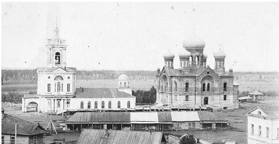
Рисунок 6. Вознесенско-Преображенский собор на Соборной площади, г. Глазов [12]

«Региональная уникальность» в вышеупомянутых примерах также охарактеризована единичностью и обладает принципиальной неповторимостью. Сооружения могут включать в себя черты авторской уникальности, но главным отличием становится продолжительный период времени, в котором формируется уникальность, где появление многих черт внешнего облика сооружения зависит от бытовых, экономических и средовых факторов. Так достаточно распространенный, типовой для региона проект, претерпевая множественные изменения, приобретает уникальный вид.