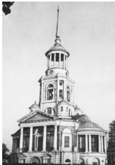
Рисунок 2. Церковь Спаса Нерукотворного [15]