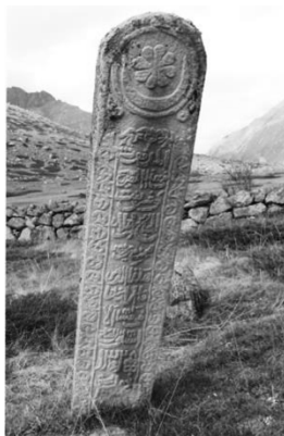
Рисунок 4. Резная надгробная стела

К произведениям народного искусства можно отнести и каменные могильные памятники (сын таш) (см. Рисунок 4). Пространство таких плит, вытесанных из местных пород камня, покрывалось вязью арабско-графичных письмен, резным растительным и геометрическим декором (зачастую довольно плотным). Использовались не только трафареты, привнесенные с Востока (как правило, через Дагестан), но и авторские задумки мастеров резьбы по камню, воплощавшие замысел техникой контурной и рельефной резьбы. В таком же стиле нередко оформлялись и семейные каменные коновязи (ам илкичле), на которых были высечены фамильные тамги, иногда даже родословия [6, с. 125].