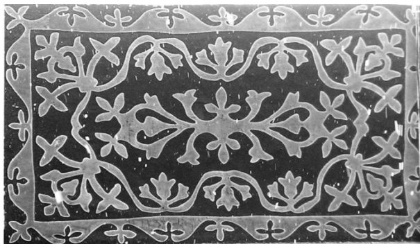
Рисунок 1. Аппликативный войлочный ковер

Войлоки использовались не только в интерьере жилища, но и служили постелью, применялись во многих традиционных обрядах, выступали одним из главных составляющих приданого.