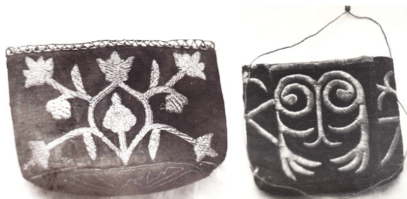
Рисунок 2. Кисет. Вышивка золотыми нитями

Среди женских художественных ремесел шитье золотом занимало второе место, так как вышиванием украшали женские костюмы, головные уборы, мелкие предметы быта – футляры, кисеты (см. Рисунок 2), сумочки и различные вещи, используемые в быту.