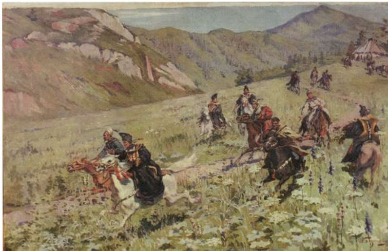
Иллюстрация 3. Л. П. Базанова. Со свадьбы. До 1910. Х., м. 77 x 117,5. Томский областной краеведческий музей, Томск