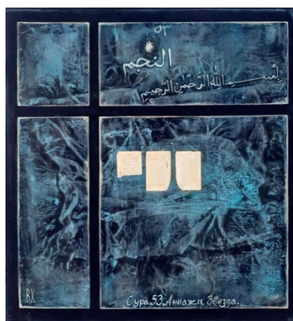
Рисунок 4. «Сура 53. Аннажм. Звезда». Василь Ханнанов