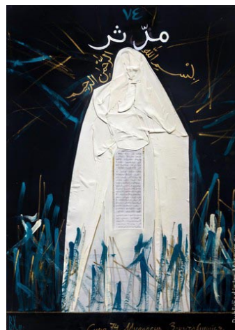
Рисунок 2. «Сура 74. Муддасир. Закутавшийся». Василь Ханнанов