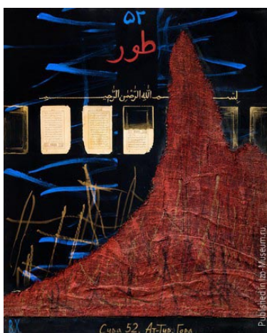
Рисунок 3. «Сура 52. Ат-Тур. Гора». Василь Ханнанов