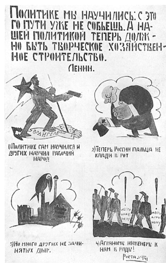
Рисунок 2. Политике мы научились. Окна сатиры РОСТА № 741. РСФСР, 1921 г.

В непростых реалиях СССР жанр политической карикатуры мимикрировал, приспосабливался, проявляясь в разных ипостасях. Это наглядно демонстрирует неоднородность всей конструкции политической системы в России. К примеру, высокую эффективность показали «Окна сатиры РОСТА» – карикатуры, стихи и фельетоны, размещавшиеся на агитационных плакатах талантливыми художниками и поэтами – сотрудниками Российского телеграфного агентства (РОСТА) в годы Гражданской войны (Рисунок 2). «Окна» решали разные задачи: легитимизация в массовом сознании партии большевиков, политическая агитация в поддержку советской власти, информационная поддержка новостей внутри страны и за рубежом. Озвучивались идеи о восстановлении разрушенной инфраструктуры страны, необходимости борьбы с инфекциями и ликвидации неграмотности, пропагандировались основы нового, социалистического типа культуры.