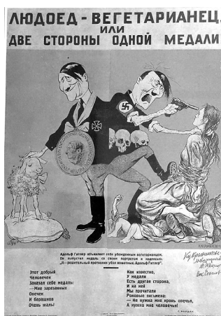
Рисунок 4. Людоед-вегетарианец. Худ. Кукрыниксы. СССР, 1941 г.