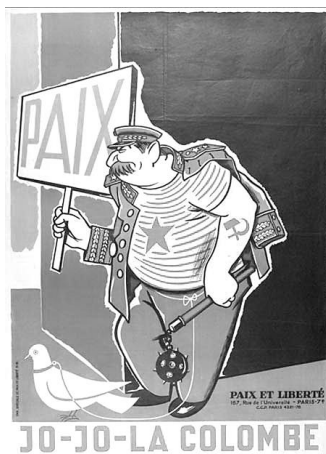
Рисунок 3. Сталин со знаком мира, голубем и кистенем. Неизвестный худ. Paix et Liberté. Франция, 1951 г.