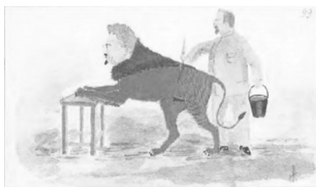
Рисунок 6. Лев Каменев перекрашивает Льва Троцкого из льва в тигра. Худ. В. И. Межлаук. СССР, 1920-е гг.

Героями рисунков являются видные партийные и государственные деятели 1920-1930-х гг. Содержание творчества отражает характер кулуарных отношений высшего эшелона советской партийной номенклатуры – личные симпатии и антипатии, а также динамика борьбы внутри элиты того времени (Рисунок 6). Можно согласиться с мыслью авторов о том, что это направление – другое измерение смешного, отличное как от наигранного оптимизма официальной сатиры, так и от альтернативной культуры частушек и анекдотов. Это была особая разновидность юмора, предназначавшегося для служебного пользования, которая долгое время была достоянием «особых папок». Карикатуры и шаржи отразили время политического плюрализма 1920-х, дискуссии вокруг НЭПа, проблемы социалистического строительства, пленумы ЦК ВКП(б), начало партийных чисток. Позднее большая часть авторов карикатур была репрессирована.