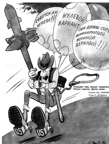
Рисунок 5. Мифы о советской угрозе. Худ. Б. Е. Ефимов. СССР, 1983 г.

Данный критический взгляд на происходящее в мире имел не только пропагандистскую направленность. Обладая такими качествами, как общедоступность, целостность и наглядность, данный тип карикатур выполнял важную функцию консолидации общества перед лицом внешней агрессии и миссию политического просвещения.