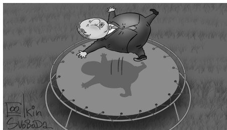
Рисунок 8. В космос – на батуте. Худ. С. В. Елкин. Россия, 2020 г.