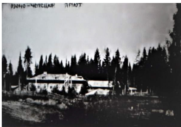
Рисунок 3. Общий вид Озново-Чепецкого приюта. 1909 г. [10]