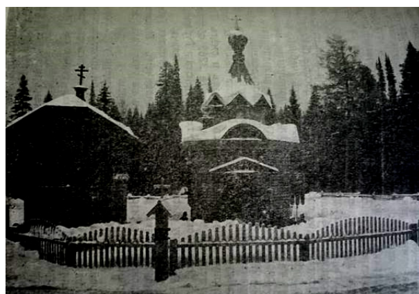
Рисунок 4. Часовня-церковь Озново-Чепецкого приюта. 1909 г. [10]