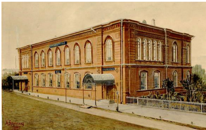
Рисунок 1. Здание Общества народных чтений (Нарышкинская читальня. 1894 год.)