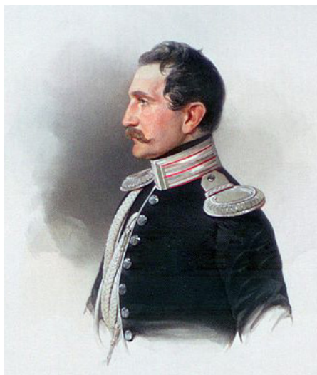
Рисунок 4. Э. Д. Нарышкин. Художник В. И. Гау, 1847 год

Здание Общества народных чтений было построено по проекту столичных архитекторов, но курировал строительство известный тамбовский архитектор А. С. Четвериков. Постройка главного здания и оснащение его всей необходимой обстановкой обошлись в 80 тысяч рублей, а устройство освещения здания – в 11 тысяч рублей [7, с. 44]. Здание построено из красного кирпича, по фасаду оно имеет два этажа, а в юго-восточной части – три. Здание было построено с учётом всех последних достижений того времени. При строительстве использовались металл, метлахская плитка, асфальт, бетон. Потолок второго этажа, изготовленный из гофрированного железа, опирается на тринадцатиметровые стальные балки. Позднее асфальтовые полы были заменены на паркетные. В подвальном помещении располагались calorifеры для отопления помещений библиотеки. Помимо главного здания, при библиотеке располагался флигель. Во флигеле находились квартиры смотрителя, библиотекаря и других служащих. Внешний облик здания, выдержанный в стиле общественных построек 80-90-х годов XIX в., сохранился почти без изменения. Для освещения читальни использовалась собственная электростанция, первая в Тамбове. Здание было по тем временам грандиозным. В верхнем этаже разместился лекционный зал, рассчитанный на 600 мест. В нижнем этаже находились народная бесплатная читальня, отделения для выдачи книг на дом, помещение для особой библиотеки с художественным отделением при ней, исторический музей [14].