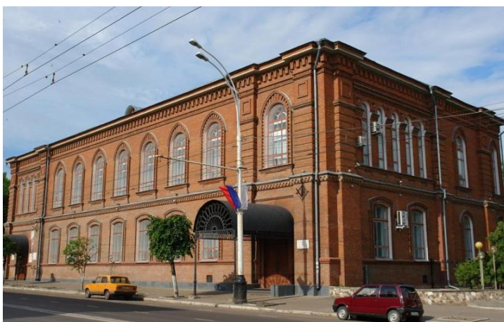
Рисунок 2. Здание Тамбовской областной картинной галереи