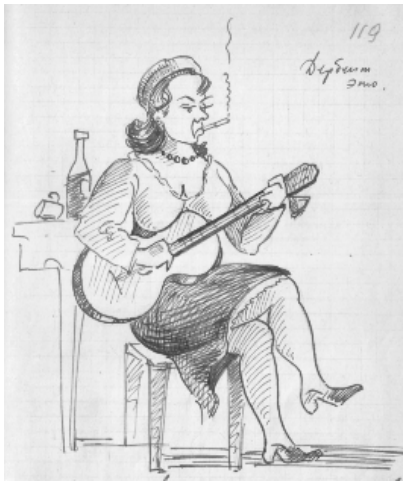
Фото 6. Сенников Г. И. Дербент это. Рисунок в «крымском» дневнике. 1945 г.