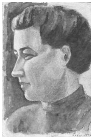
Фото 4. Сенников Г. И. Портрет Шадруновой Л. Н. Надпись: Север. 1943 г. Акварель