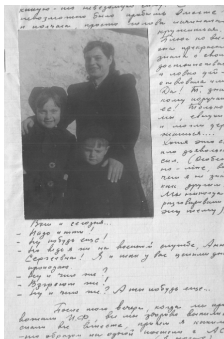
Фото 8. Фото женщины с детьми из «крымского» дневника Г. И. Сенникова. 1946 г.