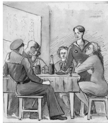
Фото 7. Сенников Г. И. Матросы с девушками. Акварель. 1945 г.