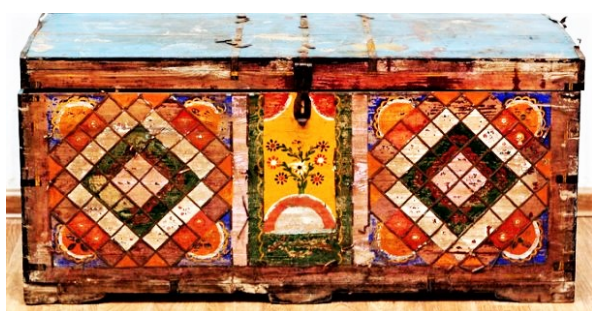
Иллюстрация 3. Сундук. II половина XX века, село Раскаты Нижегородской области (Староустьевский краеведческий музей)