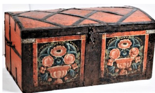
Иллюстрация 4. Сундук. II половина XIX века, город Макарьев Нижегородской губернии (или Муромский уезд Владимирской губернии) (Государственный Русский музей)