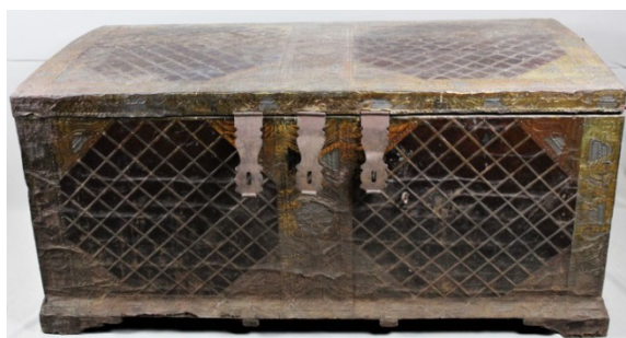
Иллюстрация 5. Сундук. II половина XIX века, город Макарьев (АЭМЗ Щелоковский хутор, г. Нижний Новгород)