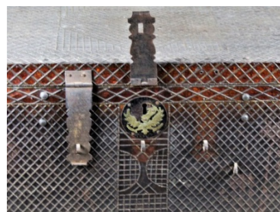
Иллюстрация 6. Сундук. II половина XIX века, город Макарьев (АЭМЗ Щелоковский хутор, г. Нижний Новгород). Деталь