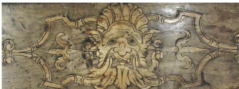
Иллюстрация 3. Свадебный кассоне. XVI век, Болонья (деталь крышки)

Крышка кассоне декорирована маскаронами в фигурных рамках (Илл. 3). Они размещены симметрично по углам и в центре крышки – всего девять изображений. Боковые стороны украшены двумя большими овалами (по одному на каждой стенке), вокруг которых в виде пышной рамки размещены прихотливо извивающиеся растительные завитки. В основании сундука – резной «ложчатый» карниз. Его четыре угла акцентированы листьями аканта.