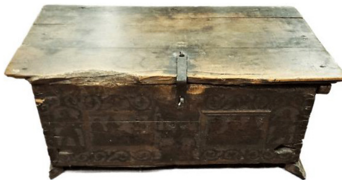
Иллюстрация 6. Сундук. Вторая половина XV века, Северная Италия. Кипарис, железо, чернила, плоская резьба, пуансон

В инвентарных книгах Псковского музея сундук атрибутируется как северо-итальянское произведение XV века. Он имеет прямые стенки и плоскую крышку, стенки соединены в «ласточкин хвост» и укреплены деревянными нагелями. Крышка и профилированное основание далеко «заплывают» за стенки, придавая изделию зрительную устойчивость. Внутри сундука сохранились пазы для досок – в его полости было несколько отделений (в аналогичных произведениях досочки украшались фигурными изображениями). На крышке укреплена кованая железная петля. Она имеет позднее происхождение – фигурная металлическая пластина, характерная для таких сундуков, отсутствует. Важно отметить, что памятник, как и предыдущий, связан со свадебной обрядностью.