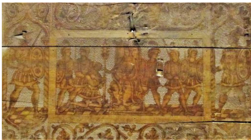
Иллюстрация 7. Сундук. Вторая половина XV века, северная Италия. Деталь

Композиции на лицевой стороне сундука и оборотной стороне крышки почти повторяют друг друга: изображения в рамках, окруженных ветвями с дубовыми листьями, с двух сторон – крупные фигуры. Вероятнее всего, они связаны и сюжетно. Не исключено, что это – тема любви, что вполне объяснимо для свадебного предмета. Отметим, что предложенное определение сюжетов не выходит за рамки рабочей гипотезы.