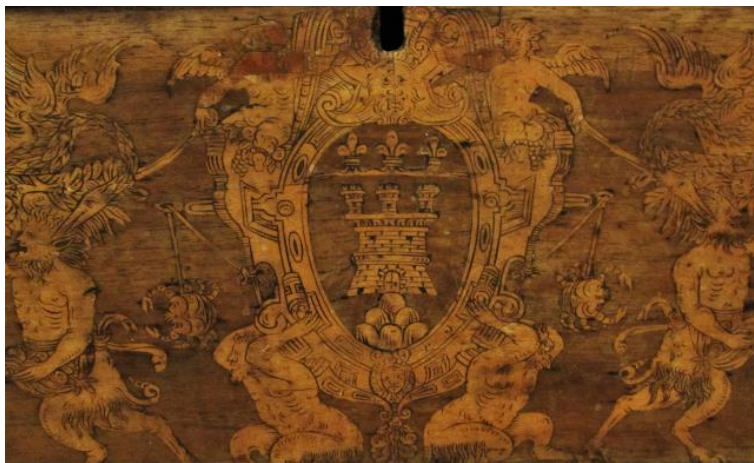
Иллюстрация 4. Свадебный кассоне. XVI век, Болонья (герб на лицевой стороне)