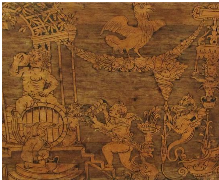
Иллюстрация 2. Свадебный кассоне. XVI век, Болонья (деталь лицевой стороны)

Крышка кассоне декорирована маскаронами в фигурных рамках (Илл. 3). Они размещены симметрично по углам и в центре крышки – всего девять изображений. Боковые стороны украшены двумя большими овалами (по одному на каждой стенке), вокруг которых в виде пышной рамки размещены прихотливо извивающиеся растительные завитки. В основании сундука – резной «ложчатый» карниз. Его четыре угла акцентированы листьями аканта.