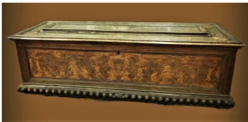
Иллюстрация 1. Свадебный сундук – кассоне. XVI век, Болонья. Ореховое дерево, резьба, интарсия

Свадебный кассоне (Илл. 1) был передан в музей в 1960 году из Государственного Эрмитажа (инв. № 3655, поступил вместе с несколькими памятниками иностранного происхождения). В 1970-е годы он был выставлен в Поганкиных палатах как образец западноевропейского сундука XVII столетия. Реставрация не проводилась. В учетно-хранительской документации он неправильно датирован XIX веком, место создания не определено, материал (сосна) указан неверно.