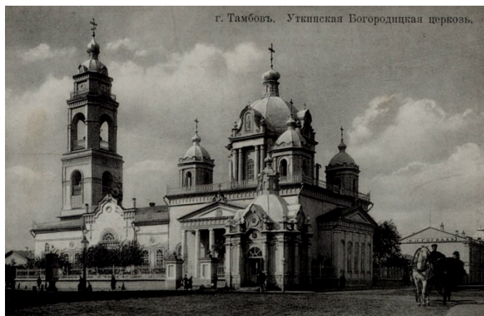
Иллюстрация 1. Уткинская церковь Пресвятой Богородицы в Тамбовской губернии