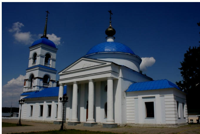
Иллюстрация 3. Церковь Успения Пресвятой Богородицы в монастырском комплексе в селе Тулиновка

Ярким олицетворением классицизма на территории Тамбовской губернии может служить монастырский комплекс, находящийся в селе Тулиновка, расположенном недалеко от современного города Тамбова (Иллюстрация 3 ( https://ruskontur.com/tulinovka-czerkov-uspeniya-presvyatoj-bogorodiczy/ )). В данный комплекс входит церковь Успения Пресвятой Богородицы, построенная в 1824 году. Ее архитектурно-пространственная композиция представляет собой высокий четверик, который обрамлен невысокой, но довольно массивной ротондой. Завершающими элементами ротонды являются шлемовидный купол и довольно изящная главка на нем. С востока к четверику присоединяется алтарная апсида, а с западной части здания примыкает трапезная, покрытая металлической двускатной крышей. Кроме того, с этой же стороны здания расположена трехъярусная колокольня, увенчанная высоким иглоподобным шпилем. Северный и южный фасады церковного здания украшены четырехколонными портиками тосканского ордера и треугольным фронтоном (Церковь Успения Пресвятой Богородицы Тулиновского Успенского Софийского женского монастыря. https://ruskontur.com/tulinovka-czerkov-uspeniya-presvyatoj-bogorodiczy/ ).